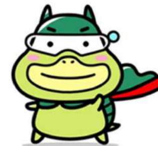
労働基準局広報キャラクター たしかめたん

全国の労働基準監督署や各都道府県にある医療勤務環境改善支援センター（勤改センター）に相談することができます。また、労働基準監督署や勤改センターでは、医療機関向けの説明会を開催していますので、そのような機会もご活用ください。