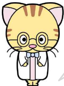
医政局広報キャラクター ドクニヤン